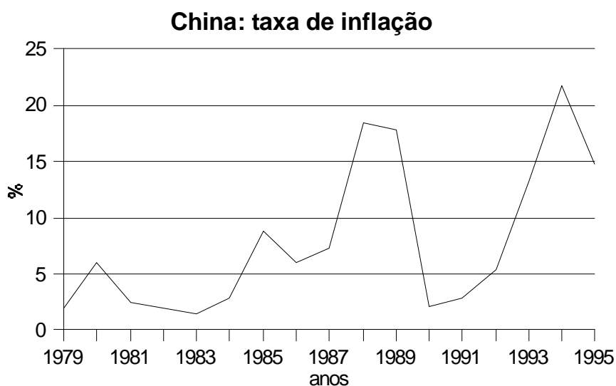
Quadro nº 30 - China: taxa de inflação